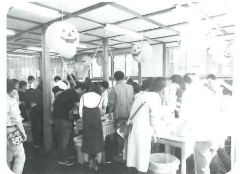
ハロウィンランタン作り