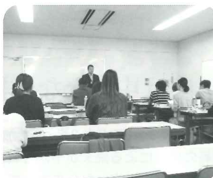
品田氏の講義の様子