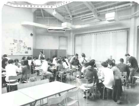
グループごとにアイスクリーム作り