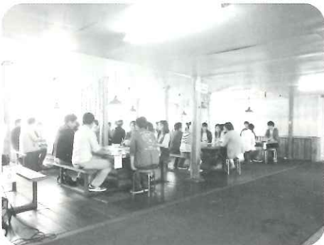
トーキングタイムの様子